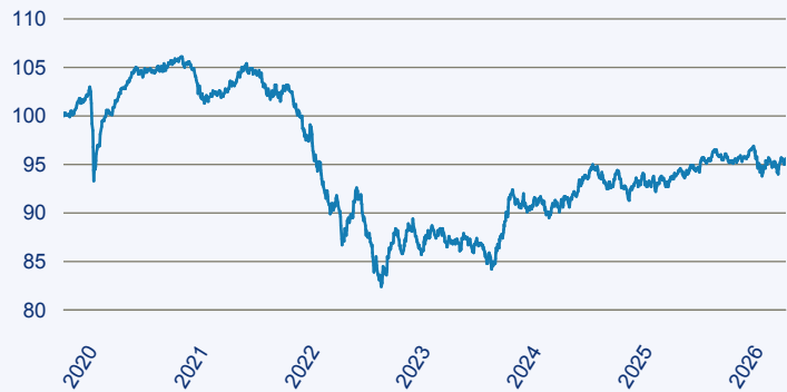
— Dimensional Global Core Fixed Income Lower Carbon ESG Screened Fund EUR A

Risiko: Die in der Vergangenheit erzielte Performance und die Ertrage lassen keinen Ruckschluss auf die zukunftige Performance und die Ertrage des Fonds zu. Der Fonds ist weder mit einer Garantie noch mit einem Kapitalschutzmechanismus ausgestattet. Der in Euro umgerechnete Wert internationaler Anlagen des Fonds kann infolge von Wechselkursschwankungen (Wahrungsschwankungen) sowohl steigen als auch sinken. Der Wert des Fonds und damit der Wert ihres Investments kann gegenuber dem Einstandspreis steigen oder fallen.