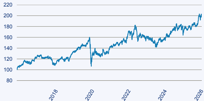
— First Sentier Global Listed Infrastructure Fund I (Accumulation) EUR

Risiko: Die in der Vergangenheit erzielte Performance und die Ertrage lassen keinen Ruckschluss auf die zukunftige Performance und die Ertrage des Fonds zu. Der Fonds ist weder mit einer Garantie noch mit einem Kapitalschutzmechanismus ausgestattet. Der in Euro umgerechnete Wert internationaler Anlagen des Fonds kann infolge von Wechselkursschwankungen (Wahrungsschwankungen) sowohl steigen als auch sinken. Der Wert des Fonds und damit der Wert ihres Investments kann gegenuber dem Einstandspreis steigen oder fallen.