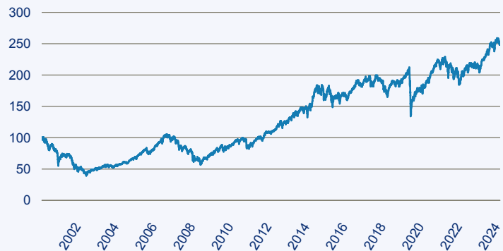
— Invesco Sustainable Pan European Structured Equity Fund A Acc EUR

Risiko: Die in der Vergangenheit erzielte Performance und die Erträge lassen keinen Rückschluss auf die zukünftige Performance und die Erträge des Fonds zu. Der Fonds ist weder mit einer Garantie noch mit einem Kapitalschutzmechanismus ausgestattet. Der in Euro umgerechnete Wert internationaler Anlagen des Fonds kann infolge von Wechselkursschwankungen (Währungsschwankungen) sowohl steigen als auch sinken. Der Wert des Fonds und damit der Wert ihres Investments kann gegenüber dem Einstandspreis steigen oder fallen.