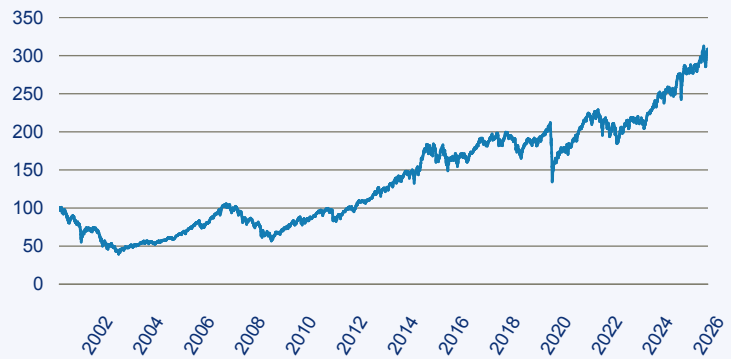
— Invesco Sustainable Pan European Systematic Equity Fund A Acc EUR

Risiko: Die in der Vergangenheit erzielte Performance und die Erträge lassen keinen Rückschluss auf die zukünftige Performance und die Erträge des Fonds zu. Der Fonds ist weder mit einer Garantie noch mit einem Kapitalschutzmechanismus ausgestattet. Der in Euro umgerechnete Wert internationaler Anlagen des Fonds kann infolge von Wechselkursschwankungen (Währungsschwankungen) sowohl steigen als auch sinken. Der Wert des Fonds und damit der Wert ihres Investments kann gegenüber dem Einstandspreis steigen oder fallen.