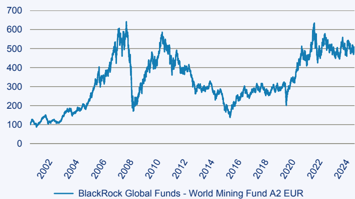
— BlackRock Global Funds - World Mining Fund A2 EUR

Risiko: Die in der Vergangenheit erzielte Performance und die Erträge lassen keinen Rückschluss auf die zukünftige Performance und die Erträge des Fonds zu. Der Fonds ist weder mit einer Garantie noch mit einem Kapitalschutzmechanismus ausgestattet. Der in Euro umgerechnete Wert internationaler Anlagen des Fonds kann infolge von Wechselkursschwankungen (Währungsschwankungen) sowohl steigen als auch sinken. Der Wert des Fonds und damit der Wert ihres Investments kann gegenüber dem Einstandspreis steigen oder fallen.