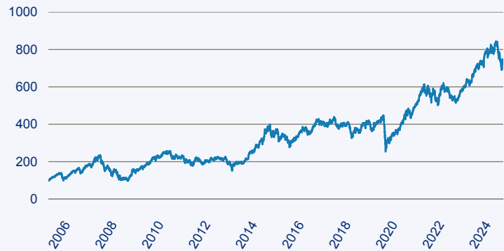
— Franklin India Fund A (acc) EUR

Risiko: Die in der Vergangenheit erzielte Performance und die Erträge lassen keinen Rückschluss auf die zukünftige Performance und die Erträge des Fonds zu. Der Fonds ist weder mit einer Garantie noch mit einem Kapitalschutzmechanismus ausgestattet. Der in Euro umgerechnete Wert internationaler Anlagen des Fonds kann infolge von Wechselkursschwankungen (Währungsschwankungen) sowohl steigen als auch sinken. Der Wert des Fonds und damit der Wert ihres Investments kann gegenüber dem Einstandspreis steigen oder fallen.