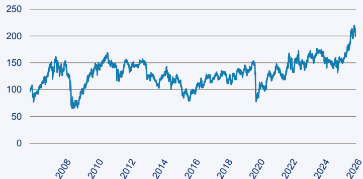
— Schroder ISF Latin American EUR A Acc

Risiko: Die in der Vergangenheit erzielte Performance und die Erträge lassen keinen Rückschluss auf die zukünftige Performance und die Erträge des Fonds zu. Der Fonds ist weder mit einer Garantie noch mit einem Kapitalschutzmechanismus ausgestattet. Der in Euro umgerechnete Wert internationaler Anlagen des Fonds kann infolge von Wechselkursschwankungen (Währungsschwankungen) sowohl steigen als auch sinken. Der Wert des Fonds und damit der Wert ihres Investments kann gegenüber dem Einstandspreis steigen oder fallen.