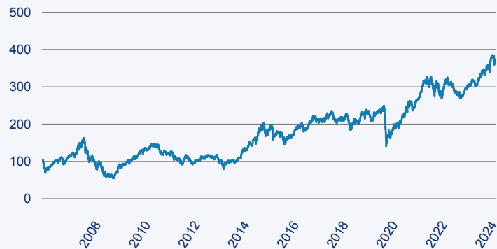
— BlackRock Global Funds - India Fund A2 EUR

Risiko: Die in der Vergangenheit erzielte Performance und die Erträge lassen keinen Rückschluss auf die zukünftige Performance und die Erträge des Fonds zu. Der Fonds ist weder mit einer Garantie noch mit einem Kapitalschutzmechanismus ausgestattet. Der in Euro umgerechnete Wert internationaler Anlagen des Fonds kann infolge von Wechselkursschwankungen (Währungsschwankungen) sowohl steigen als auch sinken. Der Wert des Fonds und damit der Wert ihres Investments kann gegenüber dem Einstandspreis steigen oder fallen.