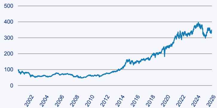
— AB SICAV I-International Health Care Portfolio I EUR

Risiko: Die in der Vergangenheit erzielte Performance und die Erträge lassen keinen Rückschluss auf die zukünftige Performance und die Erträge des Fonds zu. Der Fonds ist weder mit einer Garantie noch mit einem Kapitalschutzmechanismus ausgestattet. Der in Euro umgerechnete Wert internationaler Anlagen des Fonds kann infolge von Wechselkursschwankungen (Währungsschwankungen) sowohl steigen als auch sinken. Der Wert des Fonds und damit der Wert ihres Investments kann gegenüber dem Einstandspreis steigen oder fallen.