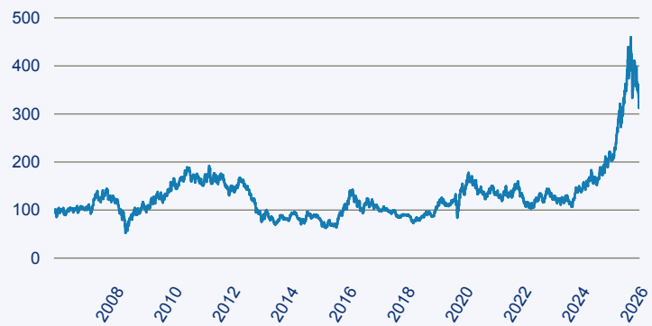
— BlackRock Global Funds - World Gold Fund D2 EUR

Risiko: Die in der Vergangenheit erzielte Performance und die Erträge lassen keinen Rückschluss auf die zukünftige Performance und die Erträge des Fonds zu. Der Fonds ist weder mit einer Garantie noch mit einem Kapitalschutzmechanismus ausgestattet. Der in Euro umgerechnete Wert internationaler Anlagen des Fonds kann infolge von Wechselkursschwankungen (Währungsschwankungen) sowohl steigen als auch sinken. Der Wert des Fonds und damit der Wert ihres Investments kann gegenüber dem Einstandspreis steigen oder fallen.