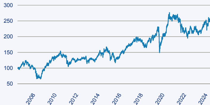
— SCHRODER ISF Global Emerging Markets Opportunities

Risiko: Die in der Vergangenheit erzielte Performance und die Erträge lassen keinen Rückschluss auf die zukünftige Performance und die Erträge des Fonds zu. Der Fonds ist weder mit einer Garantie noch mit einem Kapitalschutzmechanismus ausgestattet. Der in Euro umgerechnete Wert internationaler Anlagen des Fonds kann infolge von Wechselkursschwankungen (Währungsschwankungen) sowohl steigen als auch sinken. Der Wert des Fonds und damit der Wert ihres Investments kann gegenüber dem Einstandspreis steigen oder fallen.