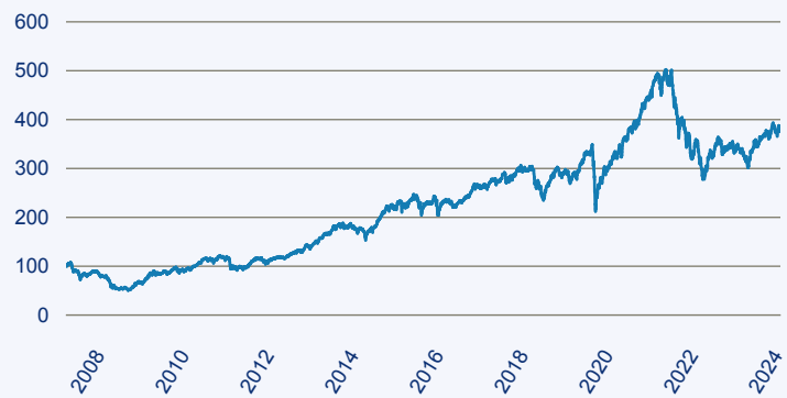
— AS SICAV II - European Smaller Companies Fund A thes.

Risiko: Die in der Vergangenheit erzielte Performance und die Ertrage lassen keinen Ruckschluss auf die zukunftige Performance und die Ertrage des Fonds zu. Der Fonds ist weder mit einer Garantie noch mit einem Kapitalschutzmechanismus ausgestattet. Der in Euro umgerechnete Wert internationaler Anlagen des Fonds kann infolge von Wechselkursschwankungen (Wahrungsschwankungen) sowohl steigen als auch sinken. Der Wert des Fonds und damit der Wert ihres Investments kann gegenuber dem Einstandspreis steigen oder fallen.