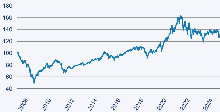
— ACATIS Fair Value Modulor Vermögensverwaltungsfonds Nr. 1 B

Risiko: Die in der Vergangenheit erzielte Performance und die Erträge lassen keinen Rückschluss auf die zukünftige Performance und die Erträge des Fonds zu. Der Fonds ist weder mit einer Garantie noch mit einem Kapitalschutzmechanismus ausgestattet. Der in Euro umgerechnete Wert internationaler Anlagen des Fonds kann infolge von Wechselkursschwankungen (Währungsschwankungen) sowohl steigen als auch sinken. Der Wert des Fonds und damit der Wert ihres Investments kann gegenüber dem Einstandspreis steigen oder fallen.