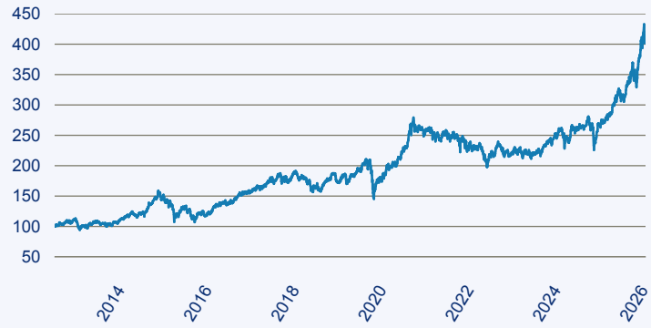
— JPM Asia Pacific Equity C (acc) - EUR

Risiko: Die in der Vergangenheit erzielte Performance und die Erträge lassen keinen Rückschluss auf die zukünftige Performance und die Erträge des Fonds zu. Der Fonds ist weder mit einer Garantie noch mit einem Kapitalschutzmechanismus ausgestattet. Der in Euro umgerechnete Wert internationaler Anlagen des Fonds kann infolge von Wechselkursschwankungen (Währungsschwankungen) sowohl steigen als auch sinken. Der Wert des Fonds und damit der Wert ihres Investments kann gegenüber dem Einstandspreis steigen oder fallen.