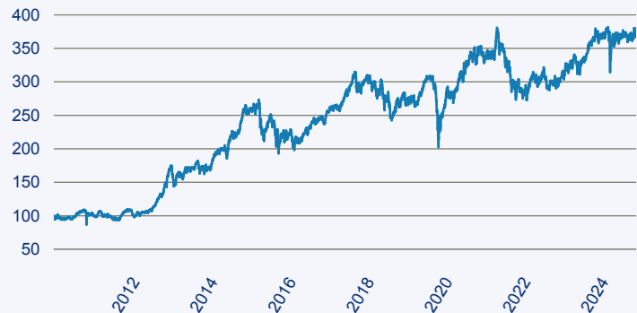
abrdrn SICAV I - Japanese Smaller Companies Sustainable Equity A Acc Hedged E

Risiko: Die in der Vergangenheit erzielte Performance und die Ertrage lassen keinen Ruckschluss auf die zukunftige Performance und die Ertrage des Fonds zu. Der Fonds ist weder mit einer Garantie noch mit einem Kapitalschutzmechanismus ausgestattet. Der in Euro umgerechnete Wert internationaler Anlagen des Fonds kann infolge von Wechselkursschwankungen (Wahrungsschwankungen) sowohl steigen als auch sinken. Der Wert des Fonds und damit der Wert ihres Investments kann gegenuber dem Einstandspreis steigen oder fallen.