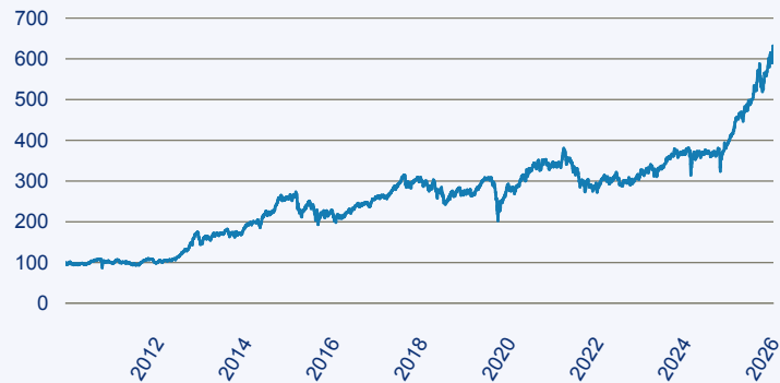
abrnd SICAV I - Japanese Smaller Companies Sustainable Equity A Acc Hedged E

Risiko: Die in der Vergangenheit erzielte Performance und die Ertrage lassen keinen Ruckschluss auf die zukunftige Performance und die Ertrage des Fonds zu. Der Fonds ist weder mit einer Garantie noch mit einem Kapitalschutzmechanismus ausgestattet. Der in Euro umgerechnete Wert internationaler Anlagen des Fonds kann infolge von Wechselkursschwankungen (Wahrungsschwankungen) sowohl steigen als auch sinken. Der Wert des Fonds und damit der Wert ihres Investments kann gegenuber dem Einstandspreis steigen oder fallen.