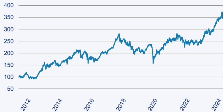
— Invesco Japanese Equity Value Discovery Fund A EUR-hdg, thes

Risiko: Die in der Vergangenheit erzielte Performance und die Erträge lassen keinen Rückschluss auf die zukünftige Performance und die Erträge des Fonds zu. Der Fonds ist weder mit einer Garantie noch mit einem Kapitalschutzmechanismus ausgestattet. Der in Euro umgerechnete Wert internationaler Anlagen des Fonds kann infolge von Wechselkursschwankungen (Währungsschwankungen) sowohl steigen als auch sinken. Der Wert des Fonds und damit der Wert ihres Investments kann gegenüber dem Einstandspreis steigen oder fallen.