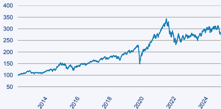
— abrdrn SICAV I - Global Small & Mid-Cap SDG Horizons Equity Fund A Acc EU

Risiko: Die in der Vergangenheit erzielte Performance und die Ertrage lassen keinen Ruckschluss auf die zukunftige Performance und die Ertrage des Fonds zu. Der Fonds ist weder mit einer Garantie noch mit einem Kapitalschutzmechanismus ausgestattet. Der in Euro umgerechnete Wert internationaler Anlagen des Fonds kann infolge von Wechselkursschwankungen (Wahrungsschwankungen) sowohl steigen als auch sinken. Der Wert des Fonds und damit der Wert ihres Investments kann gegenuber dem Einstandspreis steigen oder fallen.