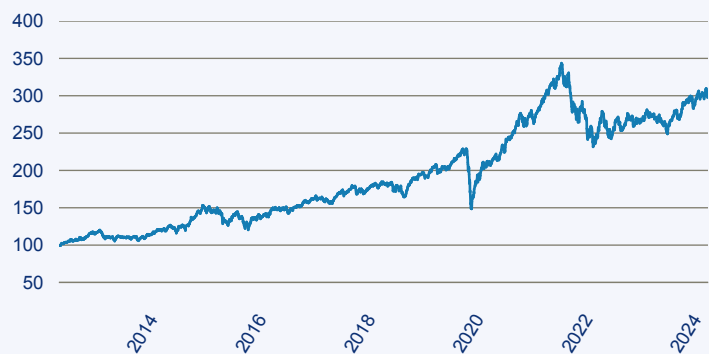
— abrdrn SICAV I - Global Small & Mid-Cap SDG Horizons Equity Fund A Acc EU

Risiko: Die in der Vergangenheit erzielte Performance und die Ertrage lassen keinen Ruckschluss auf die zukunftige Performance und die Ertrage des Fonds zu. Der Fonds ist weder mit einer Garantie noch mit einem Kapitalschutzmechanismus ausgestattet. Der in Euro umgerechnete Wert internationaler Anlagen des Fonds kann infolge von Wechselkursschwankungen (Wahrungsschwankungen) sowohl steigen als auch sinken. Der Wert des Fonds und damit der Wert ihres Investments kann gegenuber dem Einstandspreis steigen oder fallen.