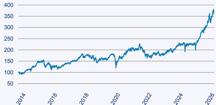
abrdn SICAV I - Japanese Smaller Companies Sustainable Equity X Acc Hedged E

Risiko: Die in der Vergangenheit erzielte Performance und die Ertrage lassen keinen Ruckschluss auf die zukunftliche Performance und die Ertrage des Fonds zu. Der Fonds ist weder mit einer Garantie noch mit einem Kapitalschutzmechanismus ausgestattet. Der in Euro umgerechnete Wert internationaler Anlagen des Fonds kann infolge von Wechselkursschwankungen (Wahrungsschwankungen) sowohl steigen als auch sinken. Der Wert des Fonds und damit der Wert ihres Investments kann gegenuber dem Einstandspreis steigen oder fallen.