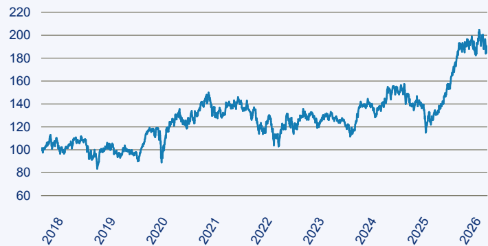
— Candriam Equities L Biotechnology R-H EUR Cap.

Risiko: Die in der Vergangenheit erzielte Performance und die Erträge lassen keinen Rückschluss auf die zukünftige Performance und die Erträge des Fonds zu. Der Fonds ist weder mit einer Garantie noch mit einem Kapitalschutzmechanismus ausgestattet. Der in Euro umgerechnete Wert internationaler Anlagen des Fonds kann infolge von Wechselkursschwankungen (Währungsschwankungen) sowohl steigen als auch sinken. Der Wert des Fonds und damit der Wert ihres Investments kann gegenüber dem Einstandspreis steigen oder fallen.