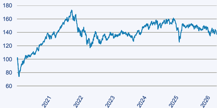
— abrdrn SICAV I - Global Small & Mid-Cap SDG Horizons Equity Fund X Acc EU

Risiko: Die in der Vergangenheit erzielte Performance und die Erträge lassen keinen Rückschluss auf die zukünftige Performance und die Erträge des Fonds zu. Der Fonds ist weder mit einer Garantie noch mit einem Kapitalschutzmechanismus ausgestattet. Der in Euro umgerechnete Wert internationaler Anlagen des Fonds kann infolge von Wechselkursschwankungen (Währungsschwankungen) sowohl steigen als auch sinken. Der Wert des Fonds und damit der Wert ihres Investments kann gegenüber dem Einstandspreis steigen oder fallen.